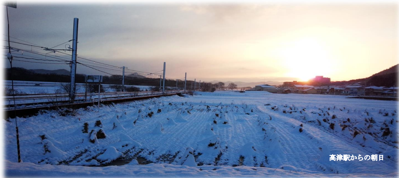
高津駅からの朝日

「我が事・丸ごと地域共生社会」という言葉を聞いたことがありますか？今政府・厚労省がしきりに使っています。「住民が、自分たちが暮らす地域について考え、困っている課題に我が事として取り組み解決していく社会」ということだそうです。 一見美しい話ですが、見方を変えると、国・自治体の責任を放棄して、住民の自助努力で何とかせよということになります。「助け合い」や「お互いさま」は大切ですが、それは制度の隙間をうめるもの。社会保障費を削り、その穴埋めに地域住民を「勤労奉仕」させる社会はまっぴらです。 国・自治体の制度改悪を許さず、権利としての社会保障、医療・介護制度